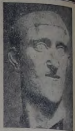
CABEZA DE MAXIMINO, OBRA ROMANA, EN MÁRMOL DEL SIGLO III DE NUESTRA ERA. (MUSEO ANTIGUO DE BERLIN)

Plénece en que, hasta fines del siglo diez y ocho, aproximadamente, los estudiosos o aficionados privados de los medios necesarios para efectuar viajes a Italia y Grecia, debían valerse para formar su gusto de dibujos imperfectos, de grabados de líneas escuetas. Los progresos de la fotografía y de los diversos procedimientos de reproducción ponen hoy al alcance de todos, modelos mucho más perfectos del arte antiguo, sin contar que las investigaciones sobre el arte han descubierto nuevos hechos y abierto nuevos campos.