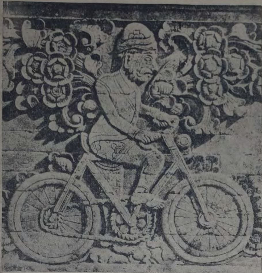
NOTABLE BAJORRELIEVE DEL TEMPLO NUEVO DE DJAGARAJA, EN LA ISLA DE BALI, QUE REVELA LA INFLUENCIA EUROPEOAMERICANA EN EL ARTE INDIGENA