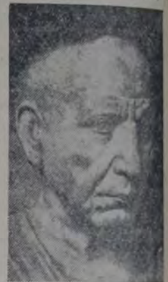
CABEZA DE ANCIANO, DE UN BAJORRELIEVE FUNERARIO DE MÁRMOL, ARTE ROMANO. (MUSEO DE ARTE ANTIGUO DE BERLIN)