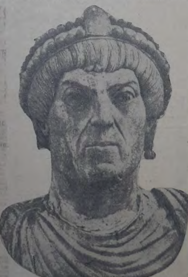
CABEZA DE LA ESTATUA COLOSAL DEL EMPERADOR ROMANO VALENTINIANO I (364-375). LA OBRA, VACIADA EN BRONCE, SE HALLA EN VARLETTA, SUD DE ITALIA