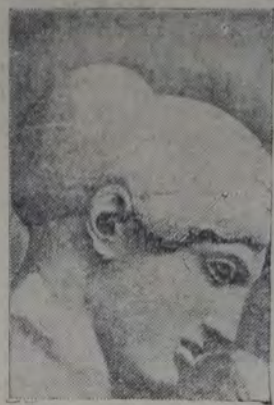
CABEZA DE NOVIA, DE UNA ESCENA DE RAPTO EN EL TEMPLO OCCIDENTAL DEL TEMPLO DE ZEUS EN OLIMPIA, GRECIA. SIGLO V ANTES DE NUESTRA ERA. (MUSEO DE OLIMPIA)

Las obras de arte de la antigüedad, creadas hace dos o tres mil años, son todavía para nosotros modelos vivientes. Esparcidas en los museos del mundo entero, siguen hablando en su impercedero idioma, impregnado de "noble sencillez y de serena grandeza", y en su presencia nos sentimos conmovidos. Venos entre ellas, producciones que se aproximan extraordinariamente a lo natural, figuras de mujeres de tanta madurez y suavidad, figuras de hombres en las que la pasión se expresa con tanta fuerza, que al contemplarlas olvidamos que se trata de la imagen de seres desaparecidos hace miles de años.